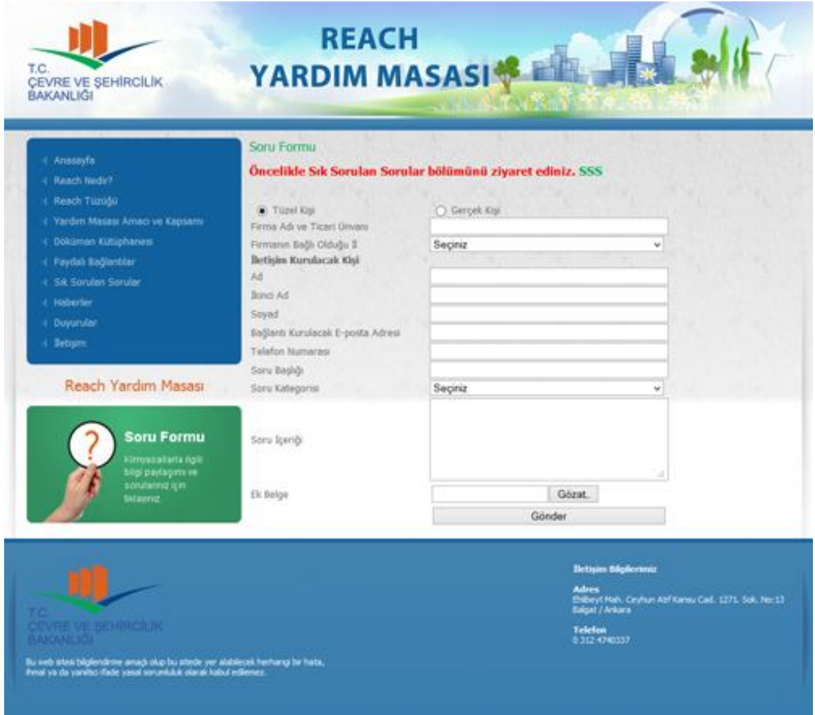
Şekil 5 Soru Formu Örnek Görünümü