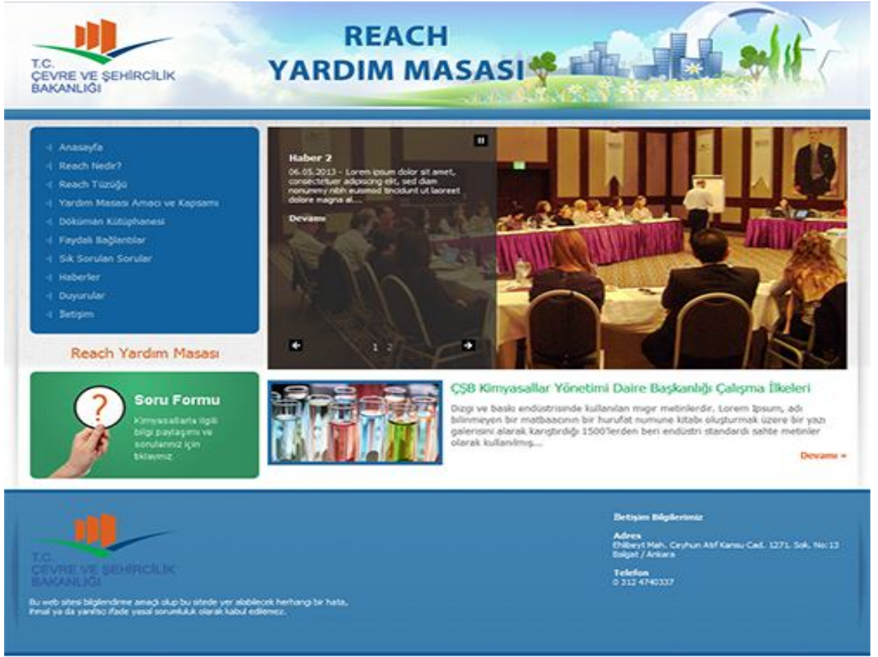
Şekil 1 REACH Yardım Masası Web Sayfası Ana Sayfa Görünümü