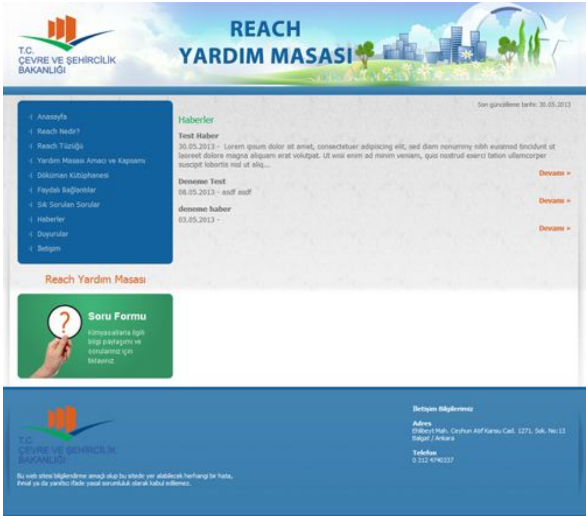
Şekil 3 Haberler Alt Sayfası Örnek Görünümü

Duyurular alt sayfası seçildiğinde ekranın sağ tarafında yayınlanan duyuruların duyuru başlığı, duyuru yayınlanma tarihi ve duyuru içeriği ile listelenmesi sağlanmaktadır. Duyuruya ait detaylara erişmek için ilgili duyuru içeriğinin altında yer alan 'Devamı' bağlantısının seçilmesi ile duyuru detayları ile mevcut ekranın güncellenmesi mümkün olmaktadır.