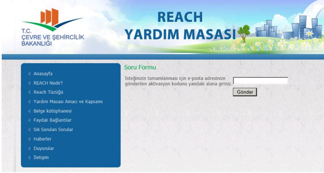
Şekil 6 Soru Formu Kapsamında Aktivasyon Girişi