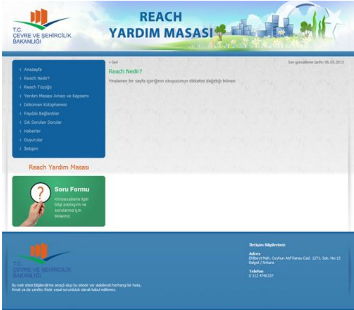
Şekil 2 Örnek Alt Sayfa Görünümü